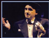
IO, ETTORE PETROLINI