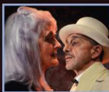
LA MORTE DELLA PIZIA