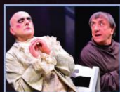
'O CURNUTO IMMAGINARIO